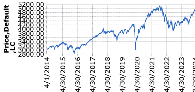
— UBS (Lux) Strategy Fund - Growth Sust (USD) P-acc